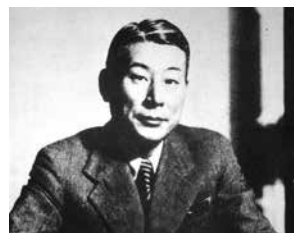
杉原千畝（すぎはら・ちうね 1900～1986）

第二次世界大戦中、日本のビザを発給して多くのユダヤ難民の命を救った杉原千畝。その生涯や功績などを紹介するパネル等の展示、講演会を開催します。