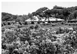
世界最大級のバラ園（5月下旬の様子）

世界最大級のバラ園が贈るバラの祭典を、5月14日（土）から6月19日（日）まで開催します。ニューローズガーデンでは世界中の最新品種を見られるほか、期間中にはナイトローズガーデン、モーニングローズガーデンやバラガイドツアー、みたけ華ずし作り体験など様々なイベントも行います。