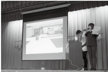
▲プレゼン発表の様子

3月15日に古川町公民館にて、「飛騨市小さなまちづくり応援事業 市民によるコンペ審査会2019」が行われました。この事業は、市内を中心として活動を行う団体等を対象に、市民自らが行う「元気であんな誇りの持てるふるさと飛騨市」を目指すまちづくり事業プランを公募し、市民による審査によって、市が助成金を交付する制度です。どんな小さなまちづくりでも応募可能で、多くの市民に各団体のまちづくり活動を知っていただき、その活動が飛騨市全体に波及することを期待し、今回で6回目の開催となりました。