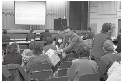
▲市民の皆さんによる投票の様子