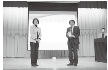
▲企業賞を受け取った団体