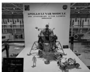
アポロ月着陸船・月面走行車（1/15模型） （全国人工衛星・探査機模型製作コンテスト受賞作品）

人類初の月面着陸から50年。月を回る有人拠点として開発される予定の「ゲートウェイ」や有人月面探査、民間企業の宇宙開発など、最新の宇宙開発の取り組みを紹介します。