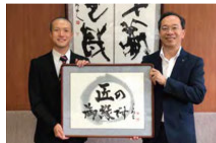
▲市長に報告!これからは楽しみ!