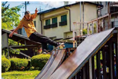
▲もっと上手になれるように練習中♪