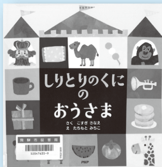
『しりとりのくにおうさま』 こすぎさなえ／さく たちもと みちこ／え PHP研究所

となりのくにおのおひめさまが、しりとりのくにおのドラゴンにさらわれた！しりとりのくにおの王様は自信满满に助けに行くが…。機転がきいた言葉遊びの絵本です。