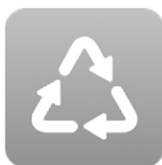
さんあ〜る アイコン

各ストアより「さんあ〜る」を検索し、アプリをインストールしてください。インストールは無料ですが、通信費は必要です。下記コードからもインストールできます。