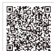
Google play (Android)