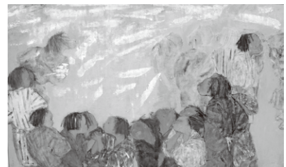
「飛騨の子供たち 別題子供群像」徳永富士子（平成2年）