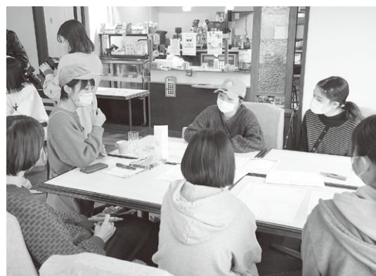
メニュー開発の様子