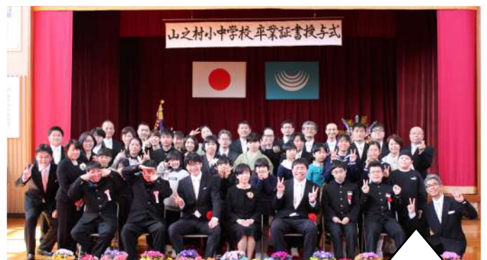
全校の児童生徒と保護者が参加する卒業式