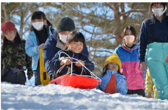
地域と一緒に楽しむ雪上運動会