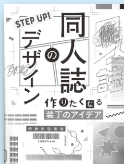
『STEP UP! 同人誌のデザイン』 ビー・エヌ・エヌ

本のデザインや装丁をステップに分けて順番に教えてくれます。文字・色・レイアウト・紙の加工などことん凝ったお気に入りの1冊を作ってみてください。