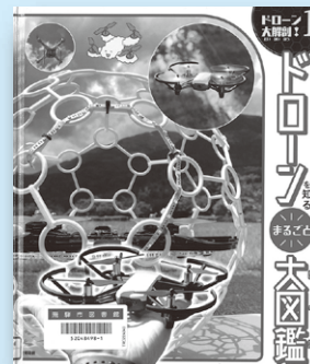
『ドローン大解剖! 1』 教育画劇

災害時や物流、農業、水中など様々な場面で活躍するドローンのことがよくわかる1冊。新しい技術に触れてみませんか？