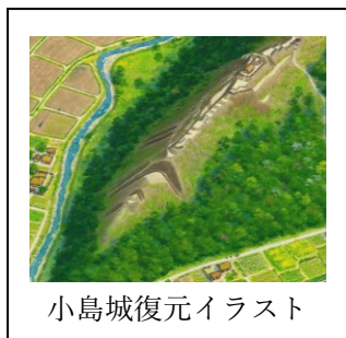
小島城復元イラスト