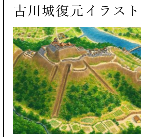
古川城復元イラスト