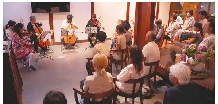
ちょっと身近な街クラシック