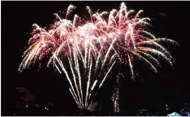
宮川こいこい花火