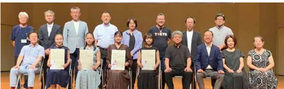
第23回飛騨河合音楽コンクール