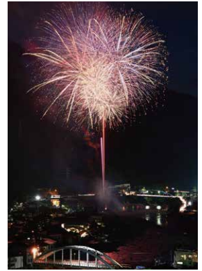
飛騨神岡夏まつり