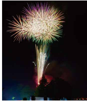
飛騨古川花火大会