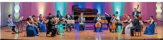
真夏の夜のコンサート

市内の魅力ある施設を巡り、伝統文化や自然、産業を 学ぶ「ふるさと巡りツアー」が開催され、小学4～6 年生19名が参加しました。今回は神岡町の高原郷土 館や江馬氏館跡公園、カミオカラボを巡りました。