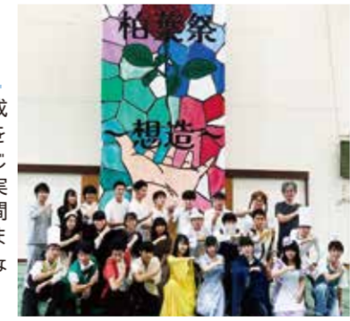
#理数科 #大学進学 #毎日が宝物

仲間との時間が最高の思い出 私は富山大学教育学部共同教員養成課程に進学しました。私が理数科を選んだ理由は3年間同じ環境、同じメンバーで生活できるからです。実際、受験期には最後まで頑張る仲間のおかげでやり遂げることができました。クラスの友達と笑いあったなげない毎日が最高の思い出です。