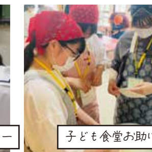
子ども食堂お助け隊