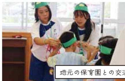
地元の保育園との交流