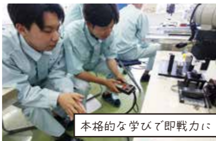
本格的な学びで即戦力に！