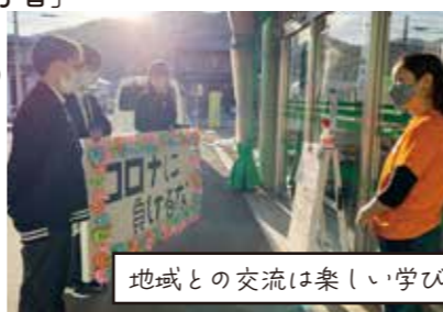
地域との交流は楽しい学び