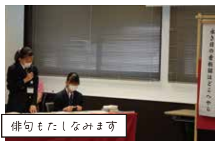
俳句もたしなみます