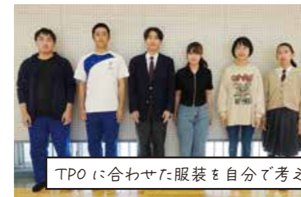
TPOに合わせた服装を自分で考える