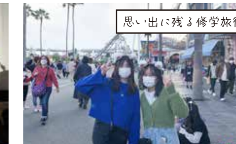
思い出に残る修学旅行