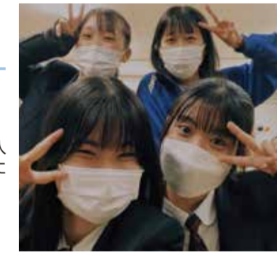
#少人数授業 #簿記 #ビジネス会計

未来に繋げる 私は、飛騨神の少人数体制に魅力を感じて入学を決めました。そのおかげで簿記を好きになり、今の会社に入るきっかけになりました。社員1人1人が、会社がより良くなるよう常に考えながら働いている会社なので、私も向上心を忘れず頑張っていました。