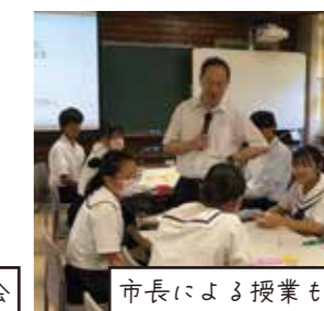
市長による授業も！