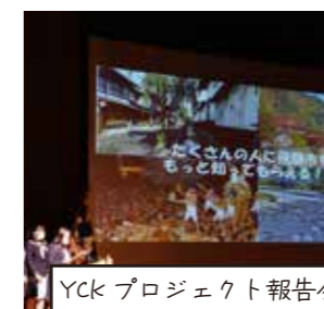
YCKプロジェクト報告会