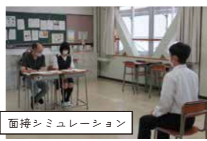
面接シミュレーション

吉高では夏休みの補習や、希望制の模試なども充実しています。 進学を考える生徒には学びのサポートは何より重要。面接対策なども手厚く、とても助かったという声。入学後に学力が伸びたという生徒も多いんです。