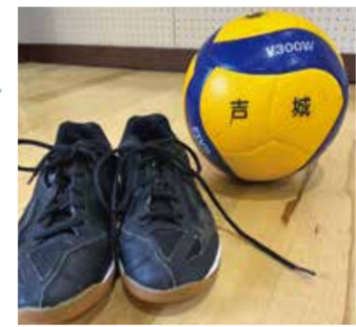
#バレー #県ベスト8 #地区優勝

仲間と努力は裏切らない! 私はバレー部です。厳しい練習もありましたが、キャプテンを中心に自分たちで練習メニューを考えて、県ベスト8、地区優勝を飾ることができました。3年間の部活動で大切な仲間ができ、努力は必ず実を結ぶと思えるようになりました。中学生の皆さんも行きたい高校に行けるよう頑張ってください!