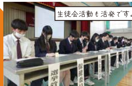
生徒会活動も活発です。

生徒総会では生徒主体で校則について議論したりしています。 今年度は制服、私服、どちらでもOKの「服装選択制」の取り組みを試しました。