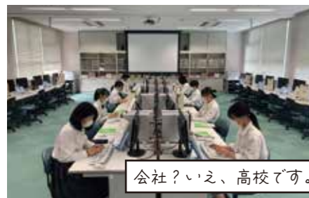
会社？いえ、高校です。