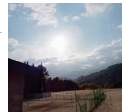
#飛騨神推し #校庭広い #毎日青春

飛騨神に決めて大正解! 私は飛騨神に入って本当に良かったと思っています! 私は運動が好きなので、部活動や球技大会など、ものすごく広い校庭でクラスの子達や優しく接して下さる先輩とできて嬉しい今すごく楽しいです! 文化祭も中学の頃にはなかった行事なので今からとっても楽しみです!