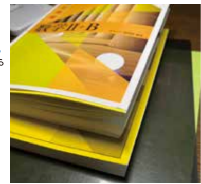
#総合コース #探究コース #選択肢

2年生になって進路を考えて 2年生からは普通科の中で専門学校や就職に強い総合コースと4年生大学に強い学び探究コースという2つに分かれます。僕は学び探究コースで国際系の4大進学を目指しています。2つのコースがあることで、自分に必要な勉強ができ、幅広い進路選択ができます。