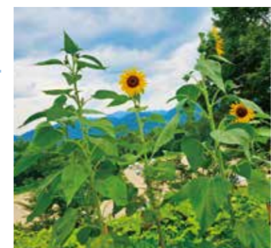
#ひまわりPJ #毎日笑顔 #仲間と一緒に

みんなと勉強頑張ってます! 私は理数科です。理数科には個性的な人が多いので、朝から笑って、元気をもらって、毎日がとても楽しいです。男女の仲も良いので過ごしやすく、勉強を教えあったり、難しい問題にも一生懸命に取り組み、わかることとても楽しいです。大学進学を目指している人におすすめです!