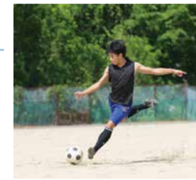
#サッカー部 #挑戦 #ボールは友達

マストアイテムはサッカーボール! 僕はサッカー部で毎日全メンバーと一緒に練習に取り組んでいます。中学生の皆さんには、部活動を頑張ってもらいたいです。部活動は、新しい挑戦のきっかけになると思います。部活でなければ知ることのなかった世界を知ることが、自分の人生を豊かにしてくれるはずですよ。