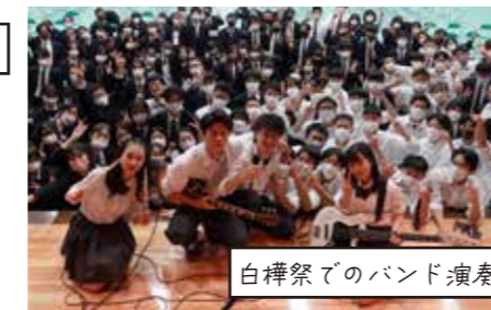
白樺祭でのバンド演奏