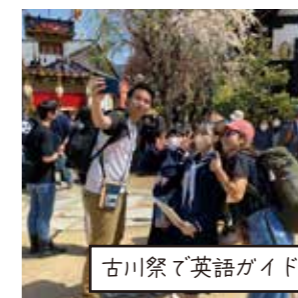
古川祭で英語ガイド