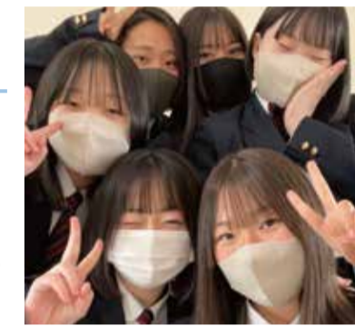
#ビジネス会計 #資格取得 #仲間

将来のために資格を取得! 飛騨神岡高校には3つの系列があり私はビジネス会計系列を選んでいきます。簿記検定やワープロ検定など色々な検定を取得することができるのがこの系列の魅力です。また、行事も沢山あって楽しい学校生活を送っています!是非一度遊びに来てください!!!