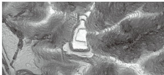
小鷹利城跡赤色立体地図