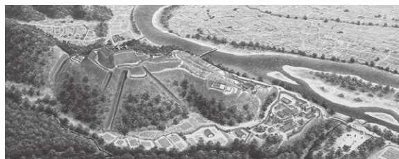
古川城復元イラスト