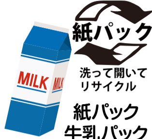
紙パック 洗って開いてリサイクル 紙パック 牛乳パック