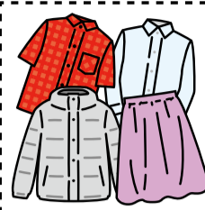
衣類 ※ユニホーム作業着は除く ※衣類は袋から出す。 回収可否はP20をご覧ください。