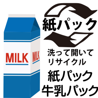
紙パック 洗って開いてリサイクル 紙パック 牛乳パック