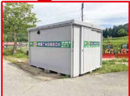
住所：神岡町山田 2358 (旧山田保育園 駐車場)