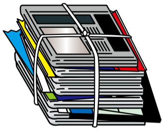
新聞紙・折込チラシ