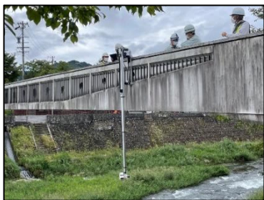
点検支援カメラによる点検 (飛騨市 古城橋)

近接目視が困難あるいは近接目視が非効率な箇所については、ドローン等を用いて効率的な点検ができるように検討を行い、修繕の際はNETIS等に掲載されている新技術と従来手法を比較し、事業の効率化やコスト削減を図る。