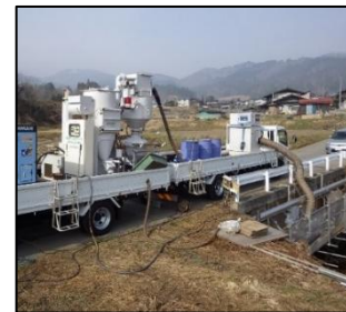
循環式エコクリーンブラストによる修繕 (飛騨市 683-1橋)