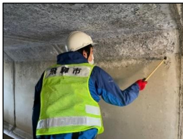
飛騨市職員による直営橋梁点検