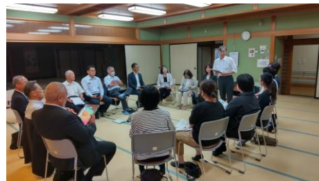
▲市民との意見交換会（保育園保護者会）

議会として調査してきた事案や市民との意見交換会で集約した意見をまとめ、12月9日に市長へ提出。令和7年2月18日、回答を受取る