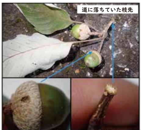
道に落ちていた枝先 殻斗(帽子)に産卵痕 枝の切断面