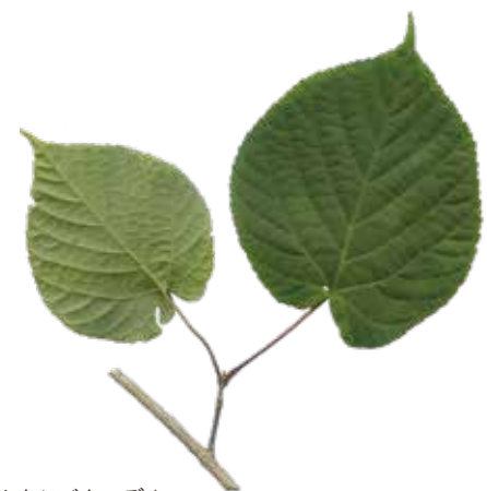
ヒトツバカエデ▲ (切れ込みない/ハート形の大きな葉)