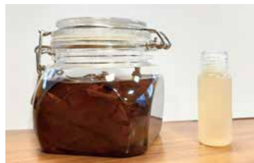
▲メナモミチンキと最新の化粧水

薬草採取のお手伝い、薬草情報、開発アドバイス、市内の中高生モニターを募集しています！私たちの活動を応援してください！！