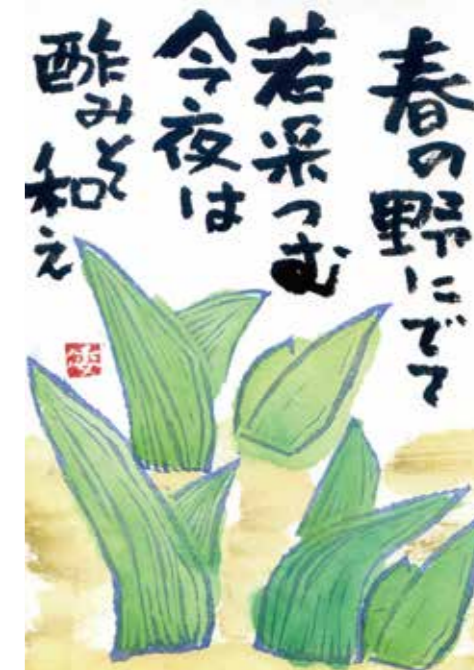
▲ノカンゾウ 絵手紙愛好家 山鼻

《発行》 2024年2月15日 発行 飛騨市薬草ビレッジ構想推進プロジェクト（飛騨市役所 まちづくり観光課内） 〒509-4292 岐阜県飛騨市古川町本町2-22 TEL 0577-73-7463 FAX 0577-73-6866 email hidayakusou@city.hida.lg.jp 《編集》 岡本文 / 飛騨市薬草ビレッジ構想推進プロジェクト