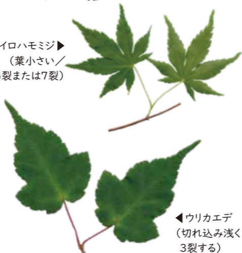
ウリカエデ▲ (切れ込み浅く3裂する)