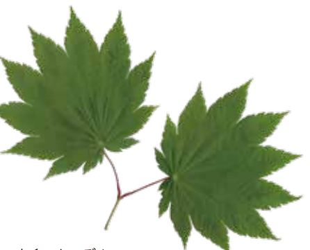
ハウチワカエデ▲ (切れ込みやや浅く9~11裂/表面のシワ目立つ)