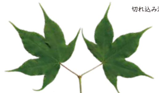
イタヤカエデ▲ (縁にギザギザなし)