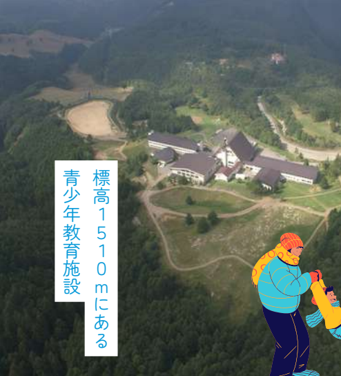
標高1510mにある 青少年教育施設