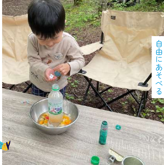
家族ごとに広大なフィールドで 自由にあそべる