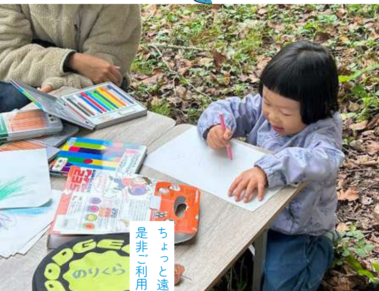
ちよつと遠出をしたい週末など 是非ご利用ください！