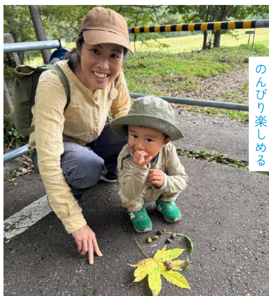
非日常を家族のペースで のんびり楽しめる