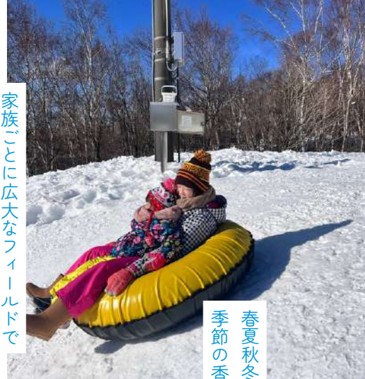
春夏秋冬がはつきりと訪れ、 季節の香りや手触りを感じられる