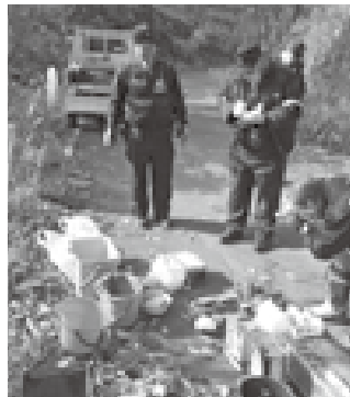
警察による不法投棄物の調査