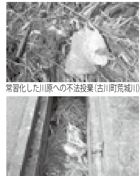
側溝に捨てられた野菜とペットボトル(古川町内)