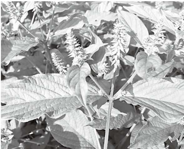
(村上光太郎「薬草を食べる」より)

膝などの痛みをとって血流を良くし、元気にしてくれるイノコヅチ、ぜひ採取してストックしておきましょう。