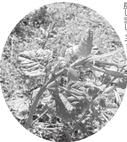
(村上光太郎著薬草療法ハンドブックより)

ぜひ疲労回復効果が高いイタドリジュースを冷蔵庫にストックして、今日はえらいなあという時にゴクッと一杯やり元気を取り戻しましょう!