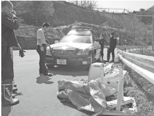
警察による不法投棄物の調査

廃棄物は決められたルールに従って処理をしなければいけません。 山林や道路や河川などに廃棄物をみだりに捨てる行為は法律により厳しく罰せられ、5年以下の懲役もしくは1千万円以下の罰金またはこの両方に処せられる重大な犯罪行為です。 用水路など側溝にごみを流す行為も同様に不法投棄となります。 一度ごみが捨てられると、そのごみが新たなごみを呼ぶように、不法投棄が誘発されることもしばしばあります。 不法投棄は、市の美観を損ねるだけでなく、土壌や地下水の汚染や生態系に悪影響を与える可能性もあります。