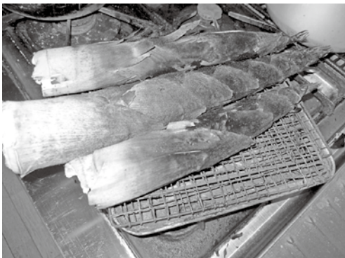
（村上光太郎「薬草を食べる」より）