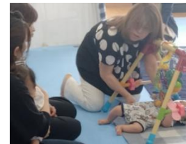
▲「身体調和支援 はぐみん」

乳幼児期から心身の発達を促す身体調和支援を継続し、外部講師なしでできる体制づくりのため、子育て支援関係者や市民が担い手となる普及体制づくりを進めます。