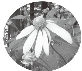
オオハンゴンソウ