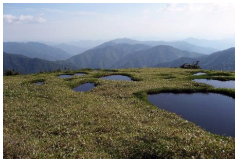
北ノ俣岳と池塘（ちとう）

標高3,000m越えの北アルプス連峰につながる北ノ俣岳、天生（河合町）・池ヶ原（宮川町）・深洞（神岡町）の三湿原、天生県立自然公園・奥飛騨数河流葉県立自然公園など、多くの自然資源が点在しています。