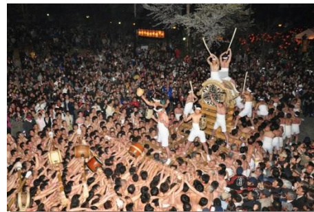
ユネスコ無形文化遺産・国重要無形民俗文化財「古川祭」の起し太鼓

毎年4月19日・20日に行われる「ユネスコ無形文化遺産・国重要無形民俗文化財 古川祭（起し太鼓）」、河合町「小雀獅子」、宮川町「へんべ獅子」、神岡町「神岡祭（時代行列）」などの代表的な伝統文化が継承されています。また、伝統産業として、「和ろうそく」、「飛騨春慶」、「山中和紙」などが長い歴史の中で受け継がれています。