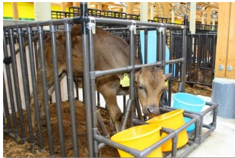
飛騨市生まれ 飛騨市育ちの飛騨牛

市内には、非鉄金属製錬業や医薬品、自動車部品、セラミック製品、電子部品、給水栓、砥石、木製家具、粉末冶金、粉末加工など様々な製造業があります。また、農業では、飛騨牛に代表される肉牛畜産や高冷地野菜のトマトやほうれん草などが盛んに行われています。