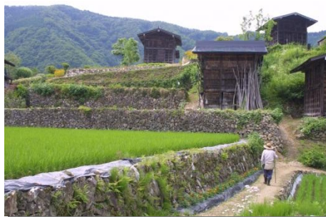
棚田と板倉が残る農村の原風景

市内には、東京大学素粒子研究施設「スーパーカミオカンデ」をはじめとした宇宙物理学研究施設、NHK連続テレビ小説「さくら」の舞台であり、アニメ映画「君の名は。」のイメージとして用いられている田舎町の風景・瀬戸川と白壁土蔵街、かおり風景100選に選ばれた棚田と板倉が残る農山村の原風景、豊かな自然と水・雪を活かした酒づくりなど、多彩で個性にあふれた地域資源が存在します。