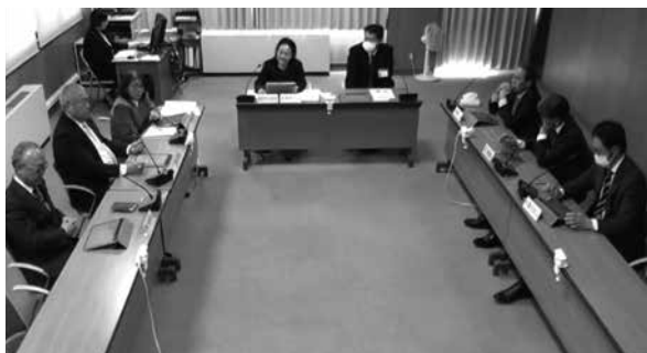
3月9日 総務常任委員会審議の様子