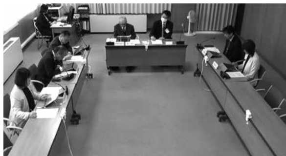
3月9日 産業常任委員会審議の様子