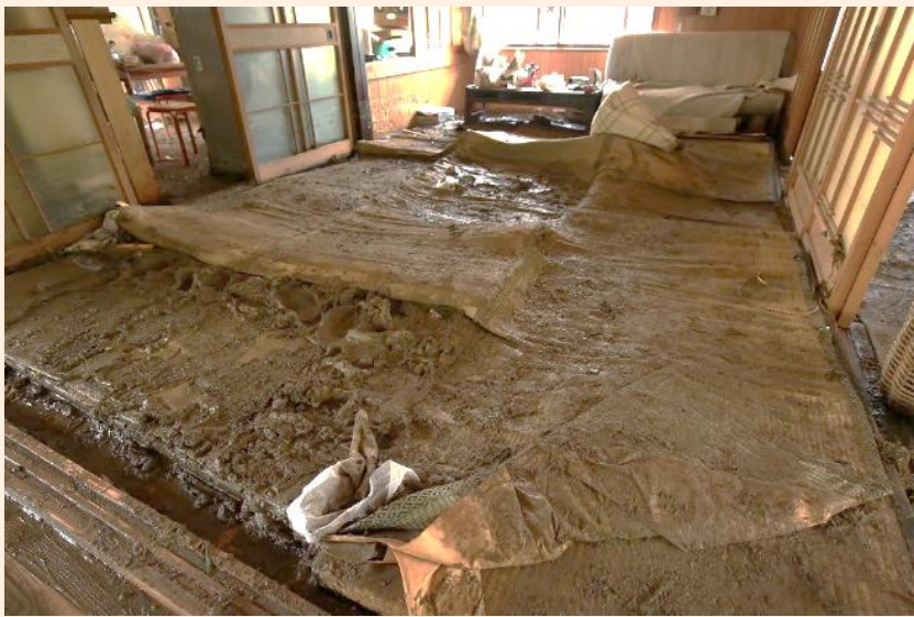
関市上之保地区