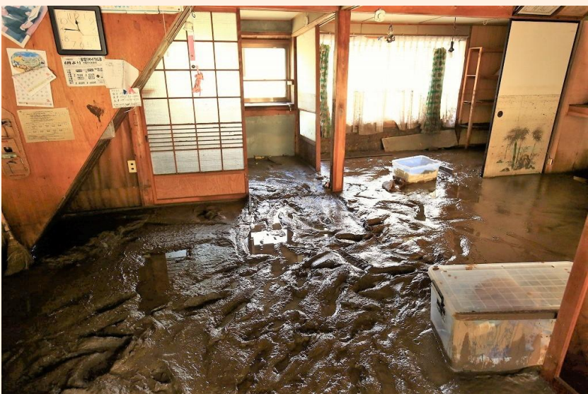
関市上之保地区