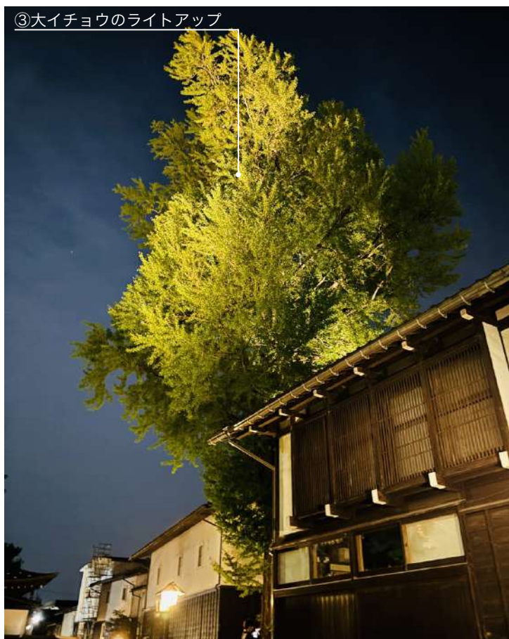
③大イチョウのライトアップ