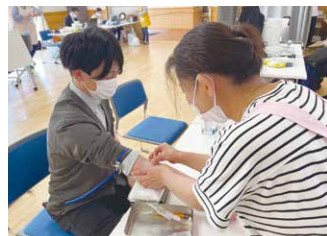
ピロリ菌検査の様子