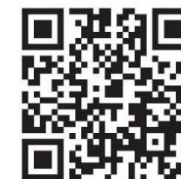
飛騨市職員採用情報サイト

＜ 飛騨市職員採用情報サイト URL https://www.city.hida.gifu.jp/site/saiyo/ ＞