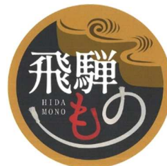
(当該事業開発商品の統一ロゴマーク)

また、これらの取り組みを通して参加事業者の経営力やマーケティング力向上を促し、飛騨市の魅力を発信できる事業者を育成します。