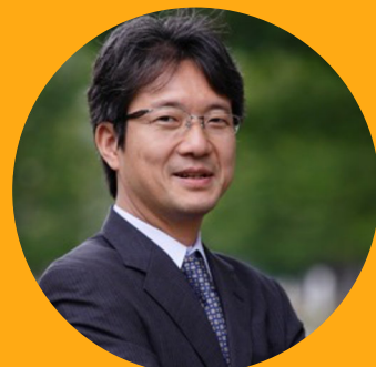
講師 森山 茂栄 東京大学宇宙線研究所 教授

イタリアで行われたダークマター探索実験XENON1T（ゼノンワントン）。 6月17日に公表された最新の結果をひもときます！ 今回、発見の可能性が指摘されている新粒子「アクション」を中心に 実際にXENON1Tで研究されている研究者の方にオンラインでお話を伺います。 当日以下のリンクからYouTube Liveへとお進みください。