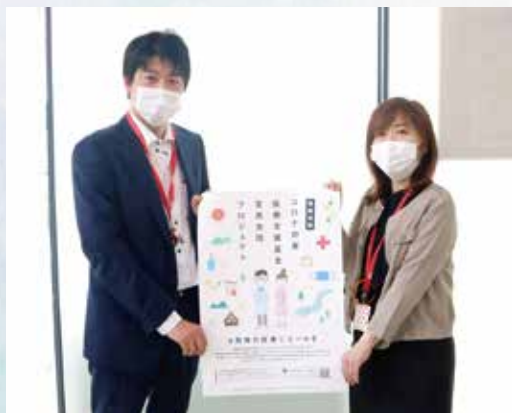
ポスターを貼る協力を してくださった事業者様

微力ながら力になればと思います。 感染症という見えない敵ですが、頑張ってください。