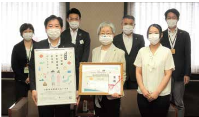
寄付をくださった事業者様からの贈呈式の様子