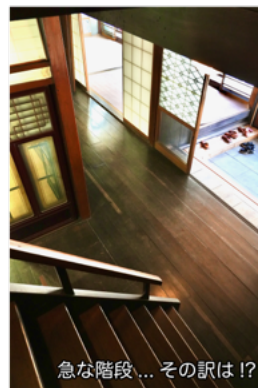
急な階段... その訳は!?