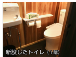
新設したトイレ (1階)