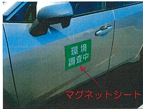
駐車車両イメージ